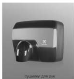
сушилки для рук