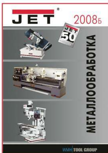
станки индивидуального применения